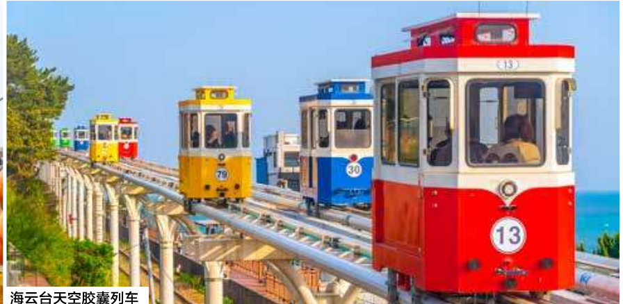
海云天天空胶囊列车

注意：由于恶劣天气的维修。满天下天空步道将改为先史博物馆及喂羊体验。发王山缆车体验改为肥皂体验。